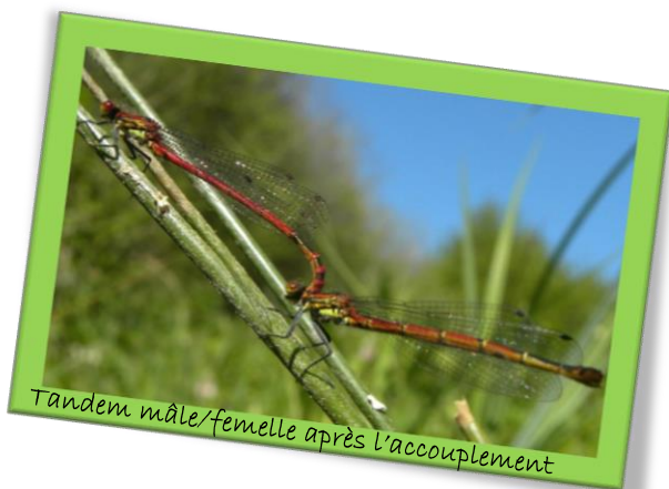
Tandem mâle/femelle après l'accouplement