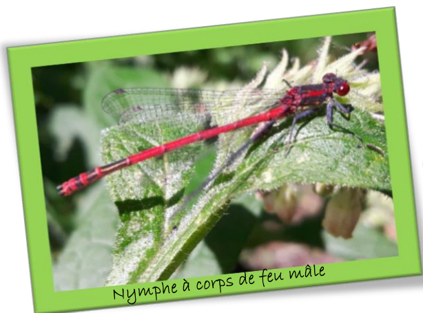
Nymphe à corps de feu mâle