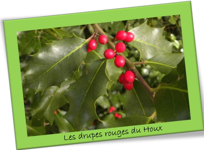
Les drupes rouges du Houx

Perche Nature recherche activement : Le Houx ( Ilex aquifolium )